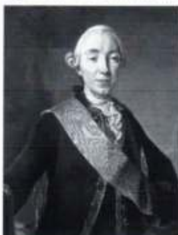
Петр II —